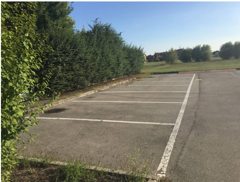
Fotografia 08 – Vista parcheggi pubblici esistenti