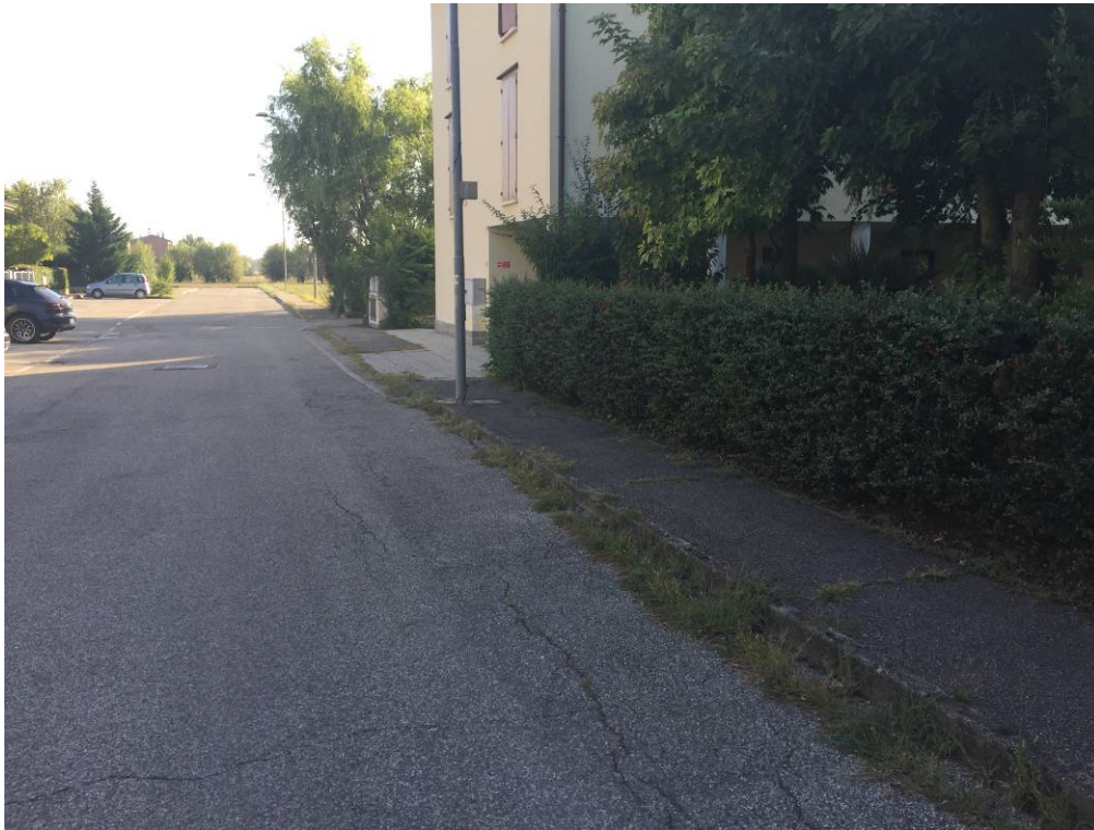
Fotografia 03 – Vista strada