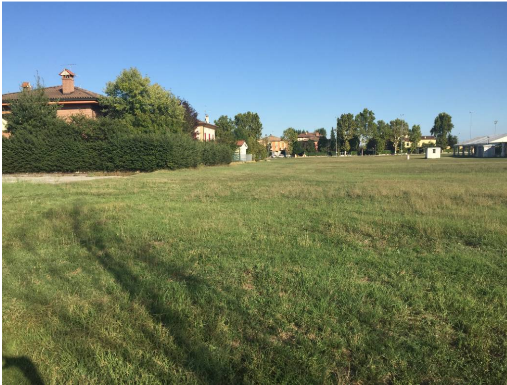
Fotografia 11 – Vista area di intervento campi esistenti