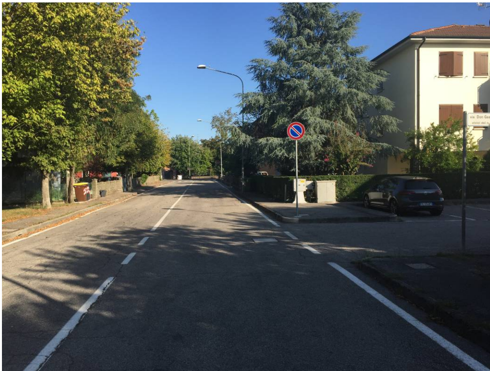
Fotografia 02 – Vista su Via Don G. Botti