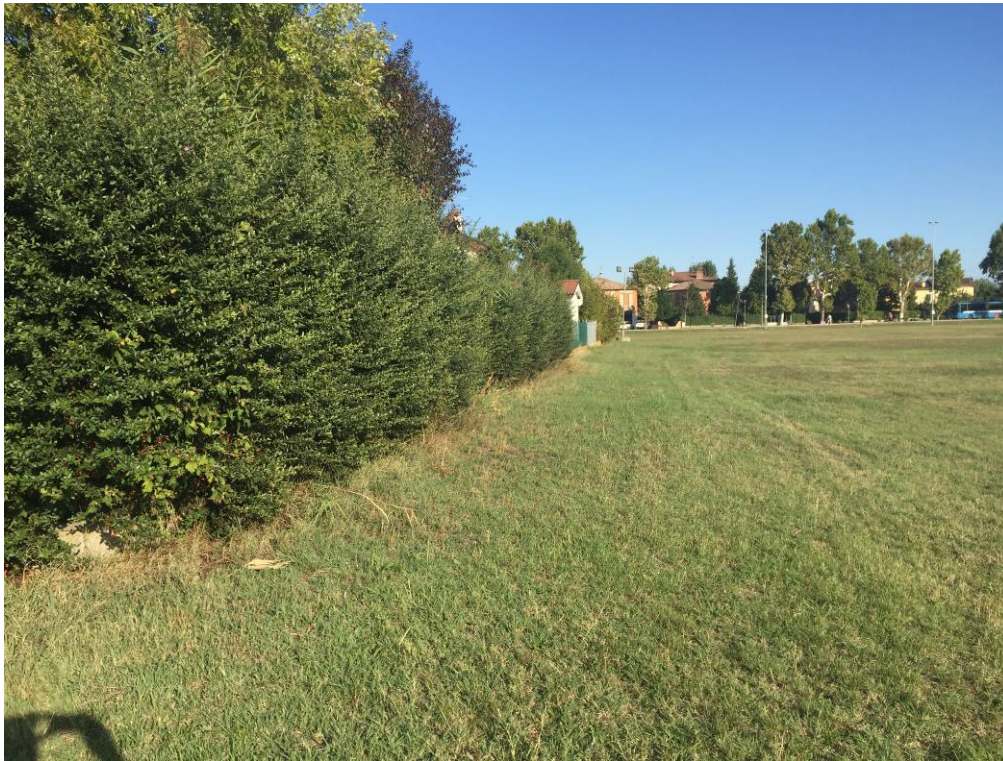
Fotografia 15 – Vista area di intervento campi esistenti