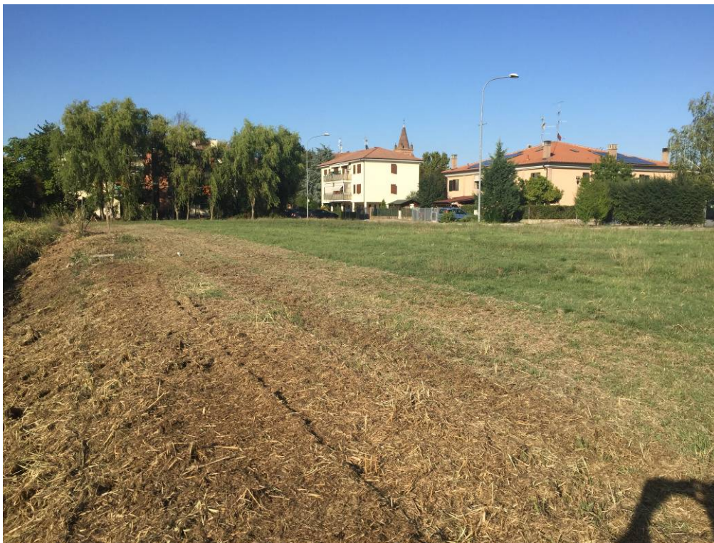
Fotografia 10 – Vista area di intervento linea fosso