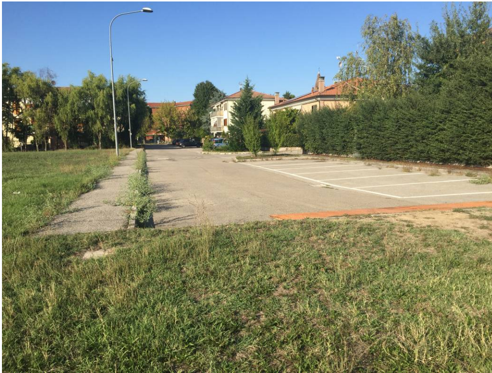
Fotografia 09 – Vista fine strada esistente