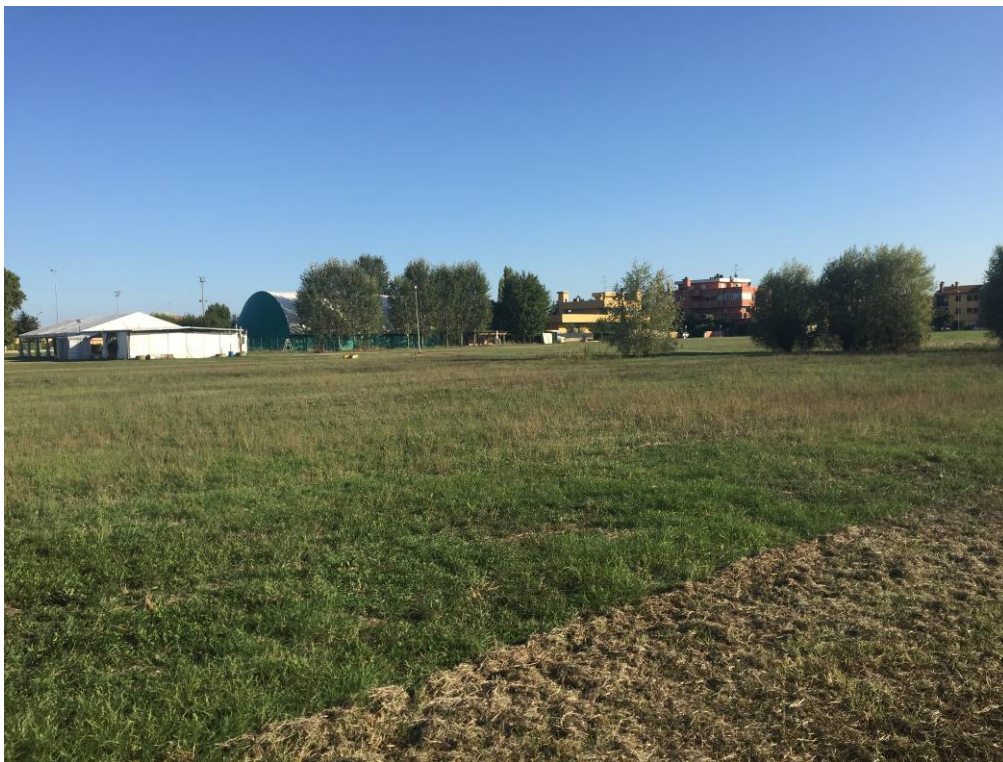
Fotografia 14 – Vista area di intervento campi esistenti