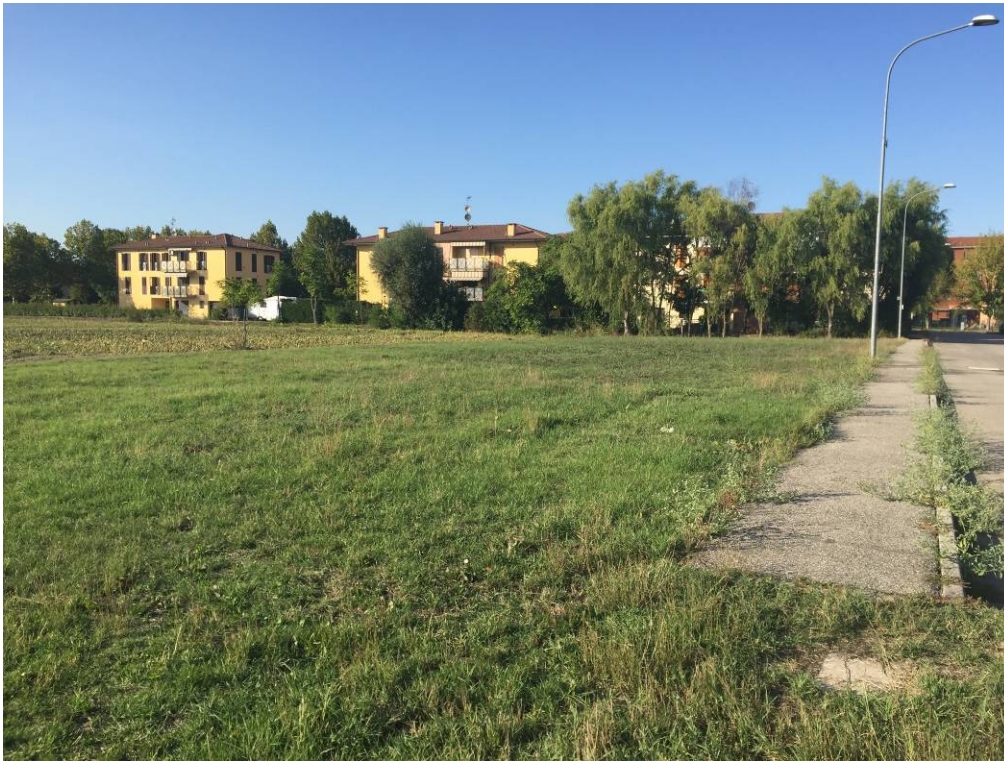
Fotografia 17 – Vista limite strada esistente