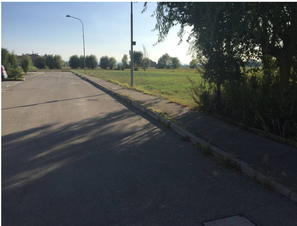
Fotografia 06 – Vista strada