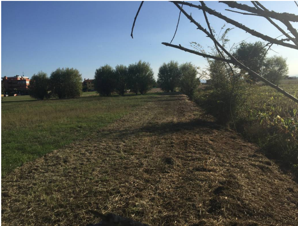
Fotografia 13 – Vista area di intervento linea fosso