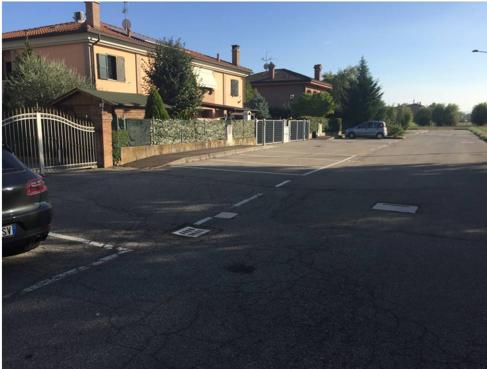
Fotografia 05 – Vista parcheggi pubblici esistenti