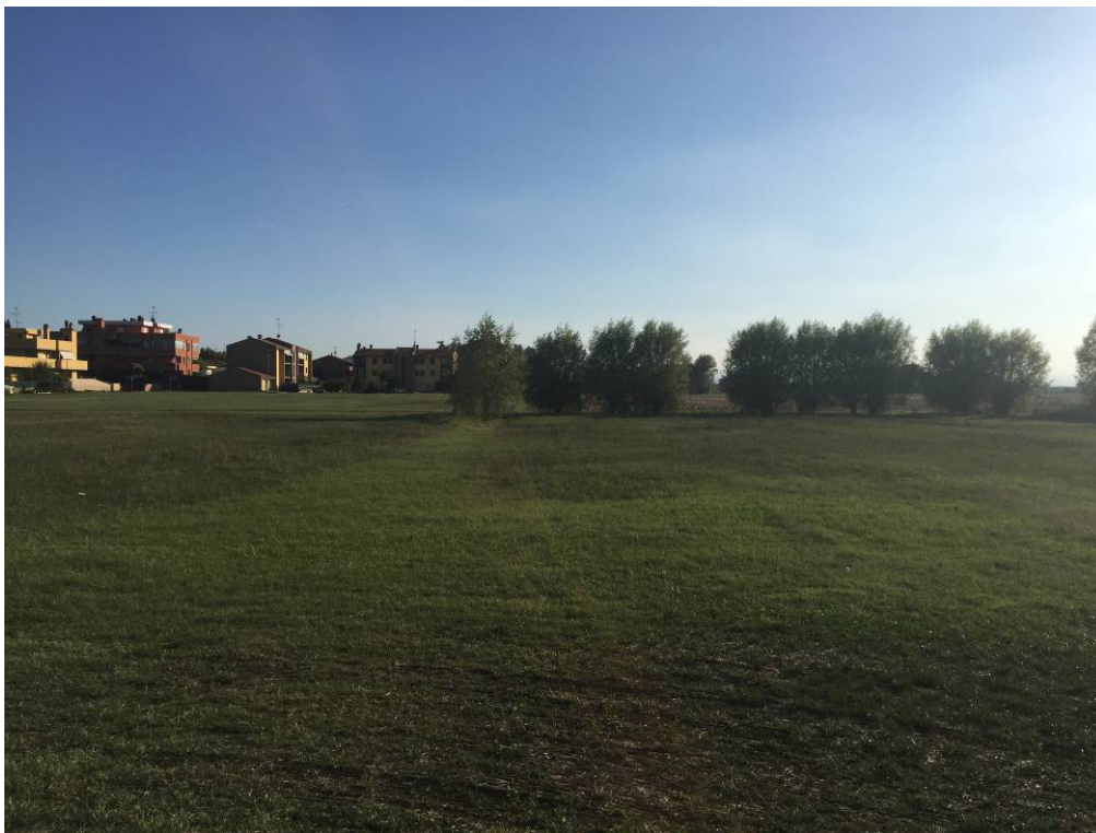
Fotografia 16 – Vista area di intervento campi esistenti