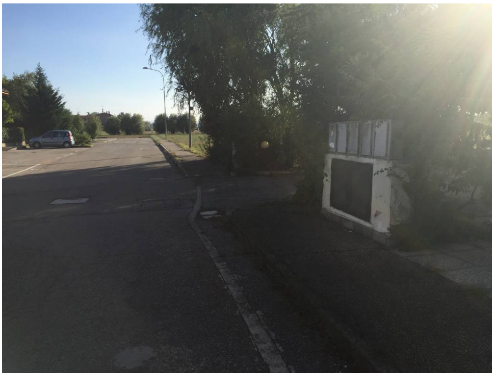
Fotografia 04 – Vista strada