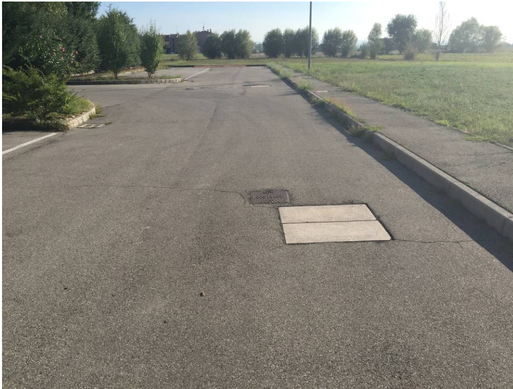
Fotografia 07 – Vista strada