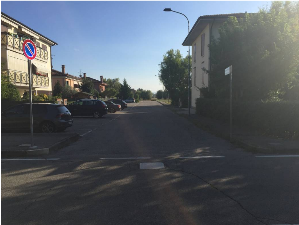
Fotografia 01 – Accesso principale da via Don G. Botti