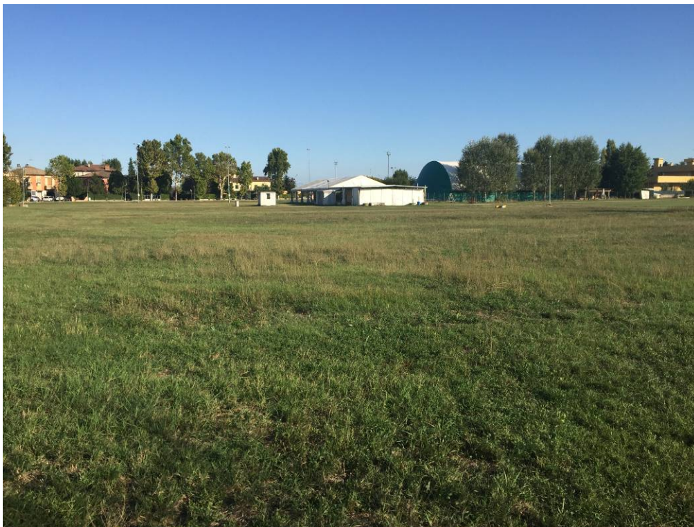
Fotografia 12 – Vista area di intervento campi esistenti