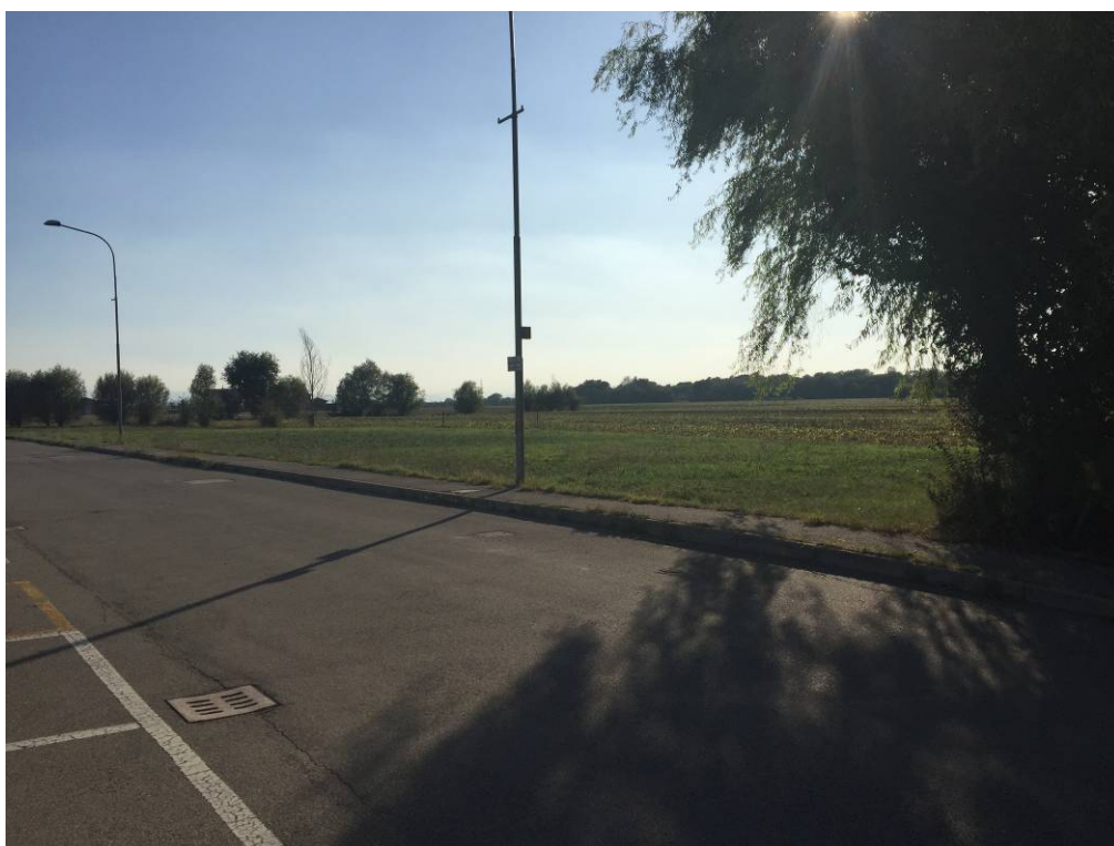
Fotografia 18 – Vista illuminazione pubblica esistente